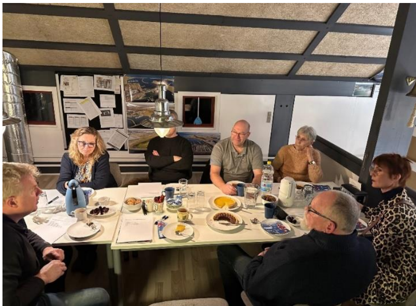
Gæsteambassadørmøde - februar 2024

Har du lyst til at høre mere om gæsteambassadører, så kontakt venligst Havnekontoret.