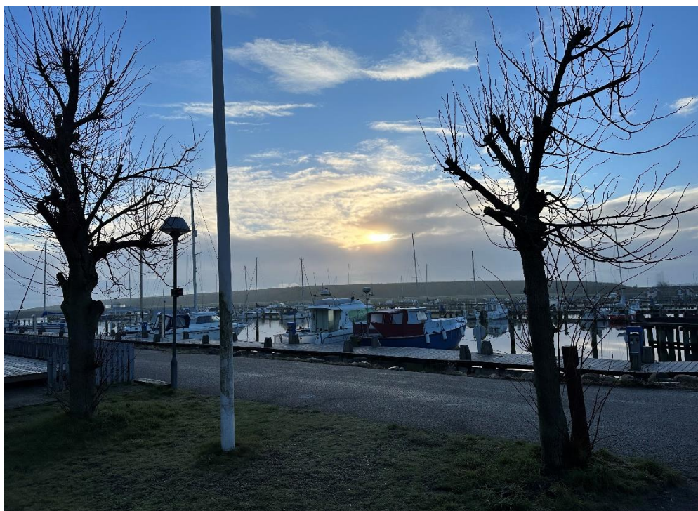
Foråret er på vej