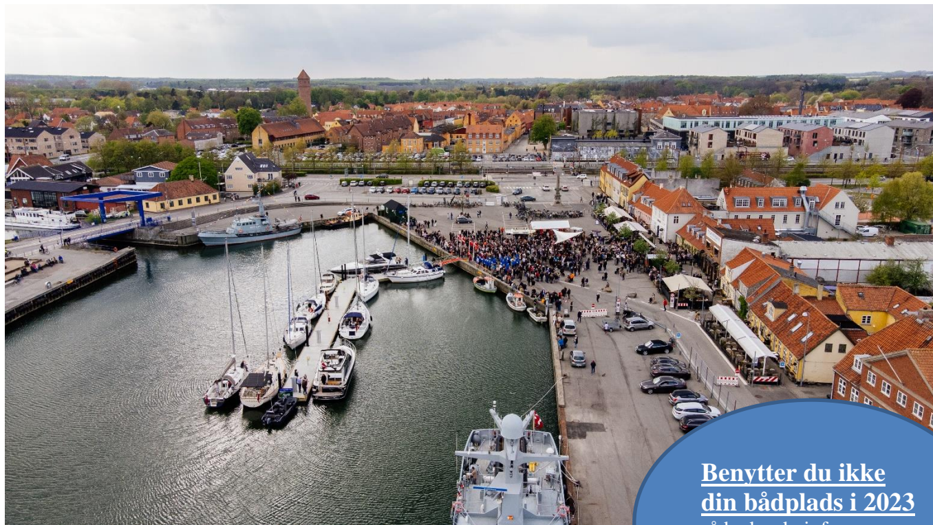
Åbning af 'Slipset' den 6. maj 2022

Benytter du ikke din bådplads i 2023 så bedes du informere Havnekontoret om dette senest den 1. maj 2023