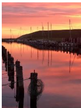
Solopgang på Køge Marina

Der vil blive serveret kaffe, kage, frugt samt øl og vand til mødet!