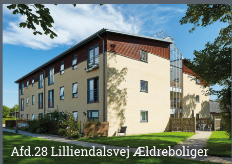
Afd.28 Lilliendalsvej Ældreboliger