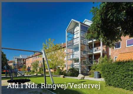
Afd.1 Ndr. Ringvej/Vestervej