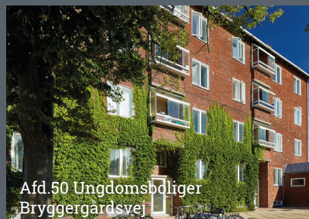
Afd.50 Ungdomsboliger Bryggergårdsvej