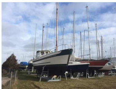
Både på land med mast i anviste rækker

Du kan tilmelde dig den mobile bådstativordning på Havnekontoret, eller finde tilmeldingsblanket på hjemmesiden, og skal du med i efteråret 2021, så skal du tilmeldes inden d. 1. august. Vil du ændre så din båd kan komme på land med mast, bedes du også bestille de ekstra ben i god tid.