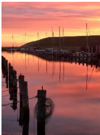
Solopgang på Køge Marina

Der vil blive serveret kaffe og kage samt øl/vand til mødet!