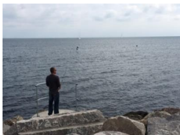
Fiskeplatforme mod syd

Du kan altid framelde sig ordningen ved at sende MARINA STOP også til 1272.