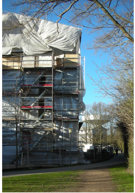
Året der gik