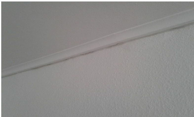
Ubetydelig revne langs liste i loft

I de fleste tilfælde er der heldigvis tale om små revner, som så vil blive ordnet (og betalt) via. Driften når lejligheden en gang fraflyttes.