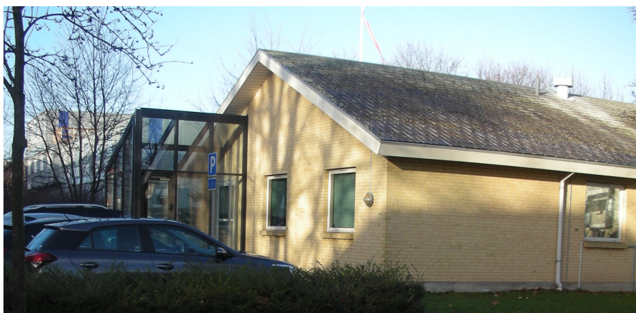
Driftskontoret, Stubben 5