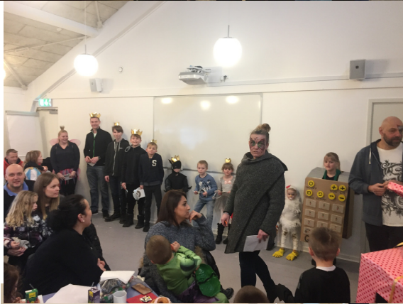
Billeder fra fælles fastelavn