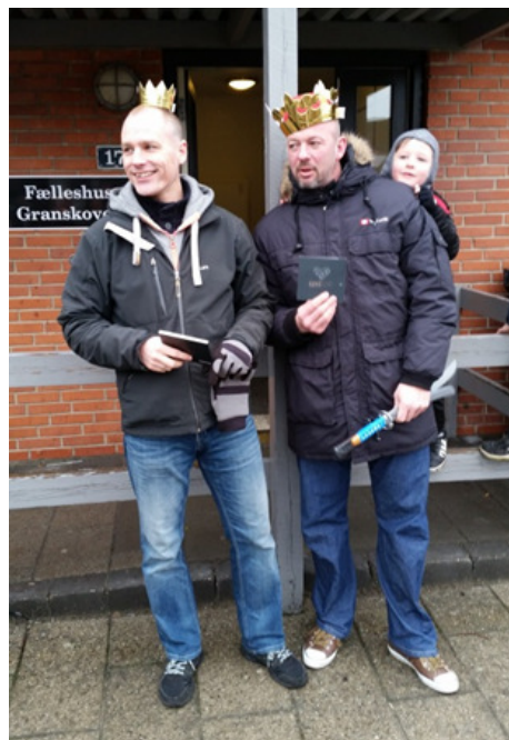
Et lille stemningsbillede fra dagen Brandmanden vandt for bedste kostume i sin aldersgruppe.