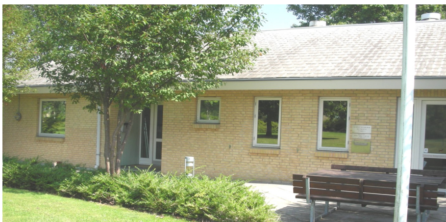
Driftskontoret, Stubben 5