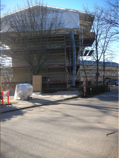
Billede: Diget