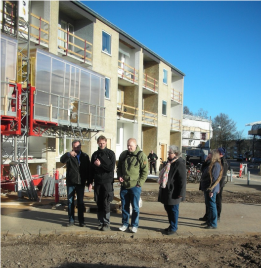
Billede: Driften og afdelingsbestyrelsen på markvandring