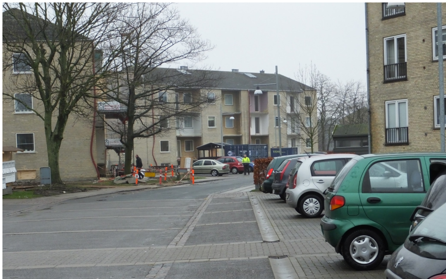
Billede: Leddet