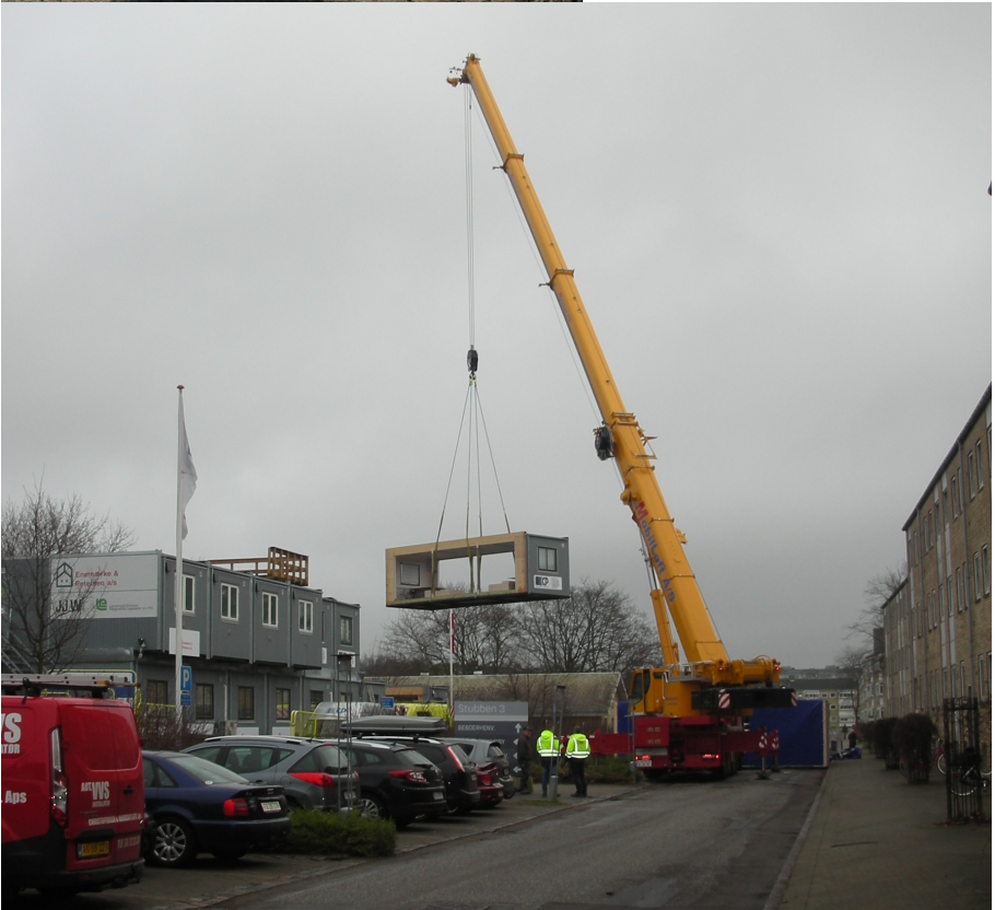
Billede: En ny skurvogn bliver sat op på Stubben 7