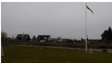
Flagstang haves. Flag-M/K søges. Henvendelse til afdelingsbestyrelsen.

re uden held. Nu kommer forår og sommer, og så er der måske én, der alligevel har lyst til at hejse flaget en gang imellem eller efter bestilling. Bestyrelsen udlagde sidst opgaven som et job med høj grad af medbestemmelse, idet vi ingen retningslinjer satte for flagningen. Dette er fremdeles tilfældet, så hvis DU har lyst til en nebengeschäft med maksimal grad af egenindflydelse, så ret henvendelse til bestyrelsen. Det skal dog bemærkes, at for denne tjans vedkommende bærer arbejdet lønnen i sig selv.