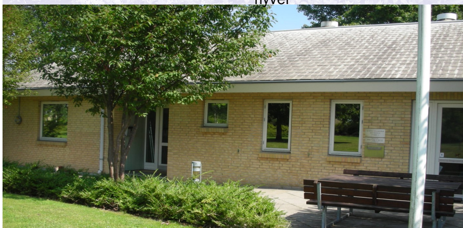
Driftskontoret , Stubben 5