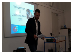
Bestyrelsen i lindeskoven