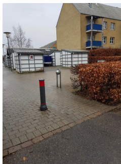
Trailerparkering i Birke-/Bøgeskoven

Der er mulighed for at stille sin trailer på de særlige pladser som ligger for enden af parkeringspladsen ved det gamle driftskontor.