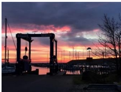
Solopgang på Køge Marina

Der vil blive serveret øl/vand til mødet!