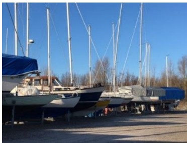
Både på land med mast i anviste rækker

Du kan tilmelde dig den mobile bådstativordning på Havnekontoret, eller finde tilmeldingsblanket på hjemmesiden, og skal du med i efteråret 2018, så skal du tilmeldes inden d. 1. august. Vil du ændre så din båd kan komme på land med mast, bedes du også bestille de ekstra ben i god tid.