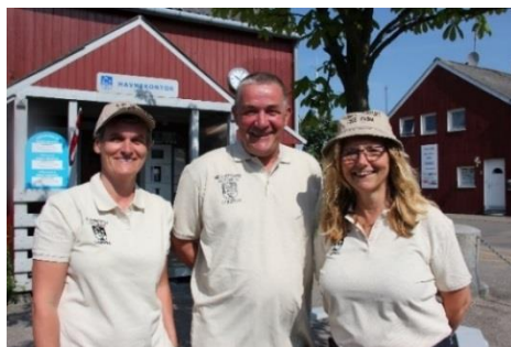
Nogle af vores frivillige Gæste Ambassadører