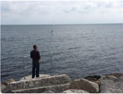
De nye fiskeplatforme mod syd