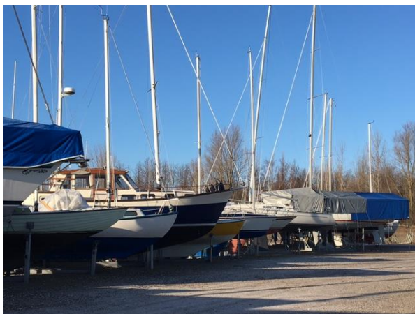
Både på land med mast i anviste rækker

Du kan tilmelde dig den mobile bådstativordning på Havnekontoret, eller finde tilmeldingsblanket på hjemmesiden, og skal du med i efteråret 2017, så skal du tilmeldes inden 1. juli. Vil du ændre til fx at komme på land med mast, skal du også kigge forbi Havnekontoret.