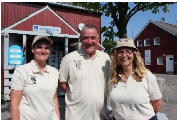
Nogle af vores frivillige Gæste Ambassadører