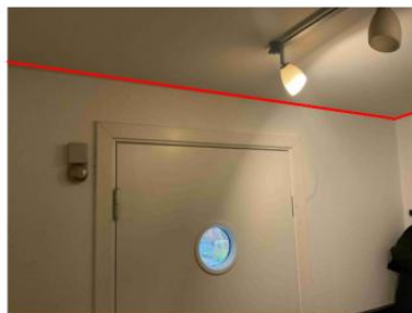
Føringsvej i loftkant