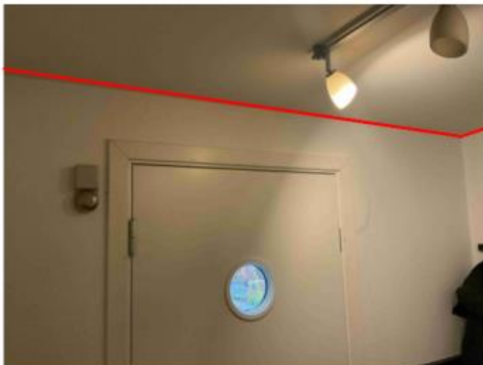
Føringsvej i loftkant